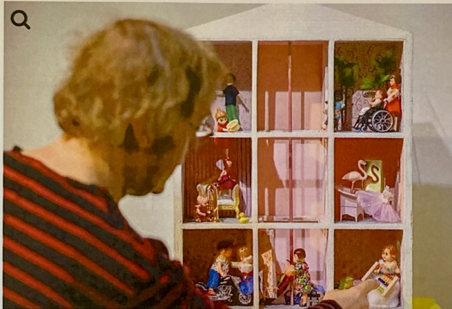
In diesem Puppenhaus wird musiziert und Motorrad gefahren.

In einer Ausstellung zeigen eine Künstlerin und zwei Künstler, was das Spielzeug nachts im Kinderzimmer so anstellen könnte. So wird zum Beispiel im Puppenhaus Musik gemacht oder Motorrad gefahren. An anderer Stelle trägt ein T-Rex ein Spielzeugauto zwischen den Zähnen. Die Ausstellung öffnet am Freitag und ist bis Anfang April zu sehen.