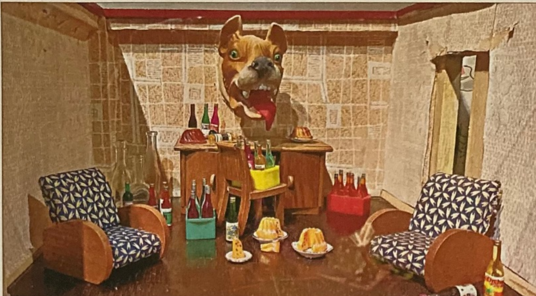
Blick in eine der zahlreichen inszenierten Puppenstuben von Marlis Hirche und Oliver Dassing. Die beiden haben einen Raum in der neuen Sonderausstellung des Puppentheaters mitgestaltet und dabei viel Liebe zum Detail bewiesen und viele Ansatzpunkte zum Erzählen von Geschichten geschaffen.

rtikel „So steigen die einpreise“, Volks- vom 12. November: preise erneut zu erhö- hen nicht nur frech, son- dern kriminell. Unser stidigte auch noch am er anlässlich des Mag- der Klimadiologs der h-Ebert-Stiftung in der iskirche in der Diskus- nde öffentlich die be- fahrpreise der MVB, in dieser Beratung be- jetzigen Beförderungs- nd die damit zeitlich nitsbegrenzungen der als unverschämte kri- zarden waren. Da kann ur hochgradig ent- sein von diesem Ge- gel unseres Stadtbri- mit der MVB-Ger- führung. In anderen dten senkt man die ise, um ihre Einwoh- veranlassen, zur Abge- erung statt ihres Flw ieber die öffentlichen bahnen und Busse zu n. Unverständlich kzeptanz durch uner- häupt, denn das Also Leute - weiter Asto zur Förderung der Un- schmutzung mit hor- riferbrauch zu horren- isen!“ schlag: Mit einer gerin- preiserhöhung könnte ann vielleicht einver- sein, wenn die Tickts zeitlich unbegrenzt ir die Hin- und Rück- nd für das Umsteigen werden können. schittko,